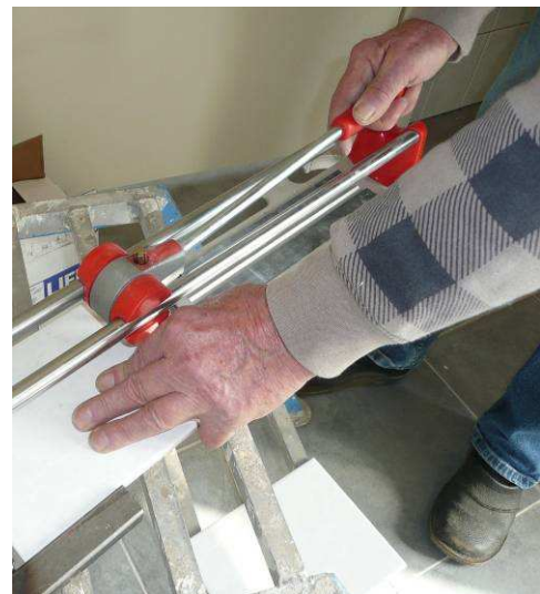
De hand van de meester...