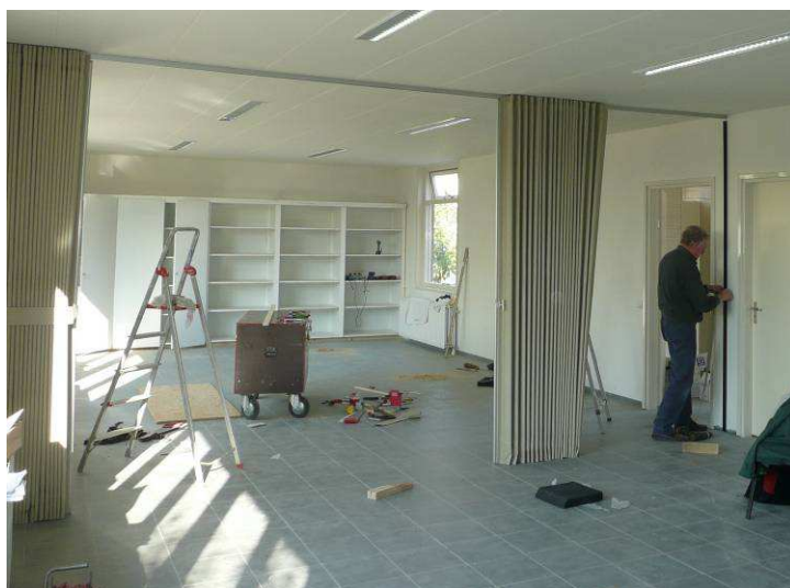
Maatwerk, de vouw wand...

Vanaf 18 september zijn opnieuw drie groepen vrijwilligers naar Bacau afgereisd. Zij hebben de elektrische installatie aangelegd, het centrale verwarmingssysteem voltooid, de wanden en plafonds afgewerkt, en het leggen van de tegelvloer – uitgevoerd door Roemenen - begeleid. Het plaatsen van de opbergkasten in de lokalen, en de geluiddempende vouw wand tussen de beide ruimtes maakten het gebouw bijna "af".