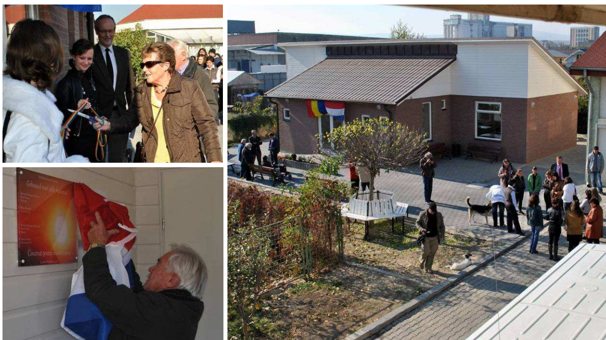
Feestelijke opening van het gebouw, 28 oktober 2011