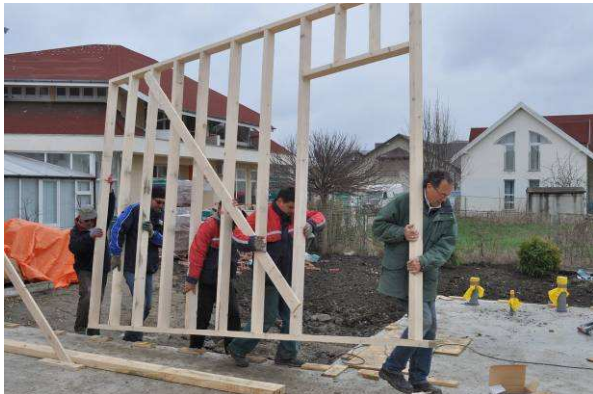
Met vereende krachten...