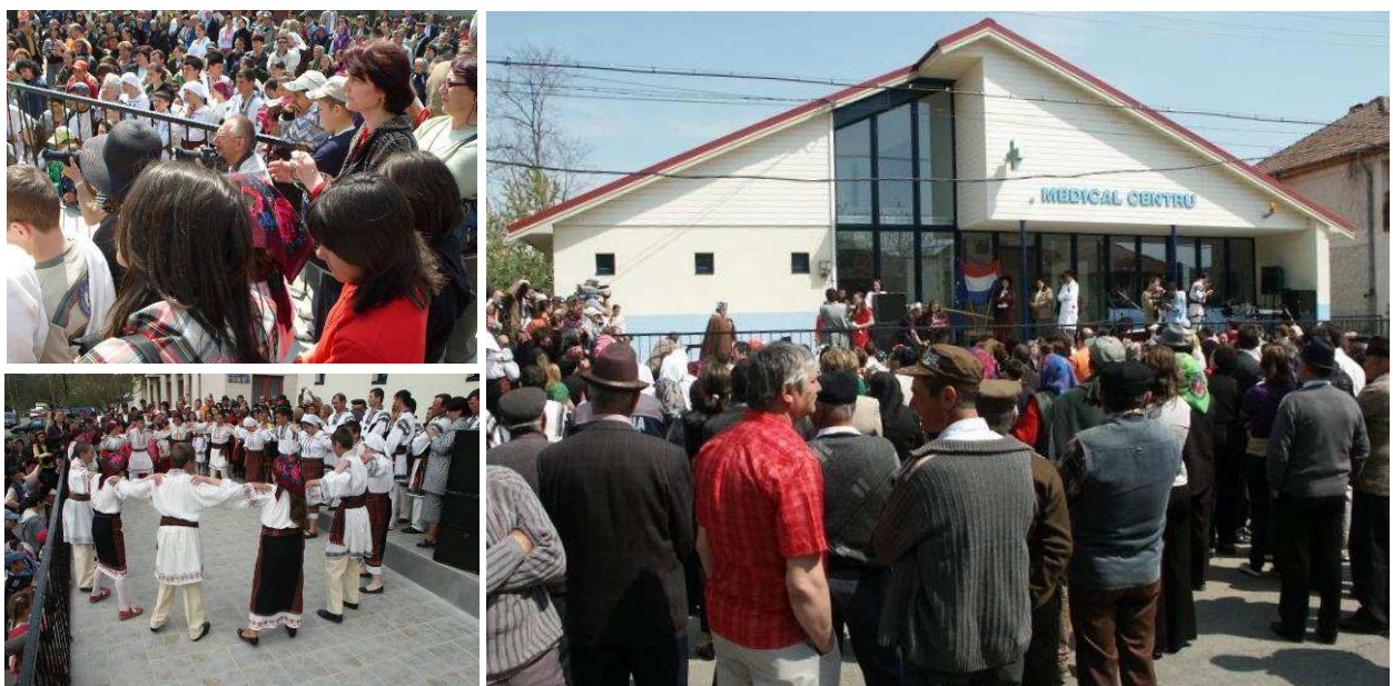
De feestelijk opening van het gebouw, 24 april 2009

In het najaar van 2008 was het gebouw zover gereed dat in december van dat jaar de apotheek in gebruik kon worden genomen, aanvankelijk nog met tijdelijk meubilair. Direct na de opening is de huisartspraktijk van start gegaan. Op dat moment was ook de woonruimte op de bovenverdieping geschikt om te worden betrokken door deze arts. De tandarts is inmiddels ook aangesteld, en met haar praktijk begonnen.