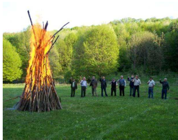
...en bij het vreugdevuur...