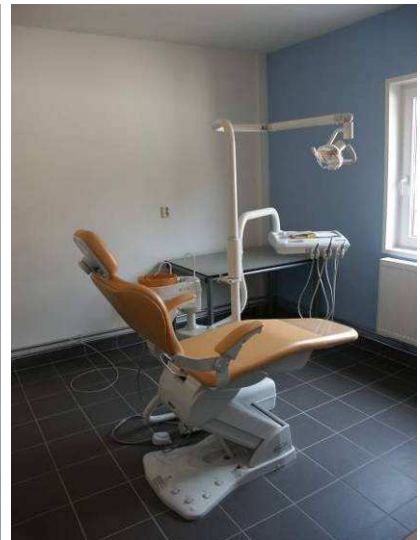
De tandartskamer ingericht