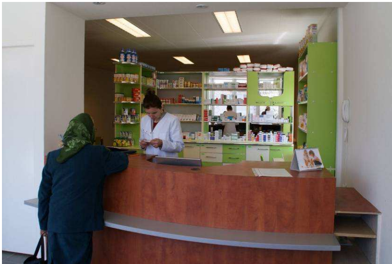
De apotheek in gebruik

De kosten van medische behandelingen worden doorberekend aan het ziekenfonds waaruit de salarissen worden betaald, maar ook water en elektriciteit.