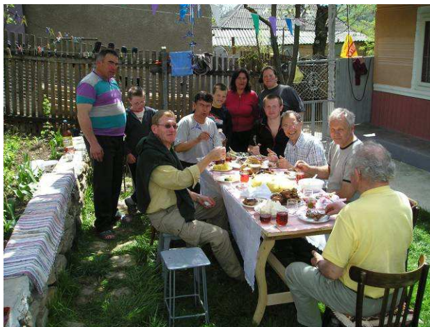
Roemeense gastvrijheid bij de mensen thuis...

In Gaiceana zijn veel mensen uit deze leeftijdsgroep al weggetrokken naar de steden. Ontwikkeling van dit soort regio's zal ertoe moeten leiden dat zij in hun eigen omgeving weer toekomst zien.