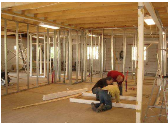
Plaatsen van de binnenwanden...