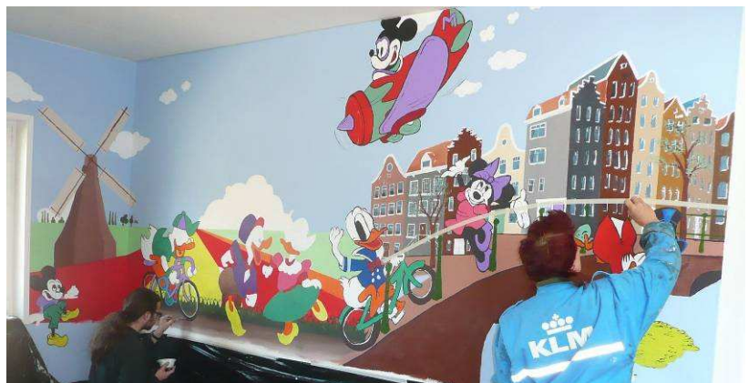
De muurschildering in de wachtkamer wordt aangebracht