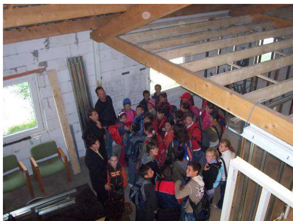
De schoolkinderen bezoeken de bouw...