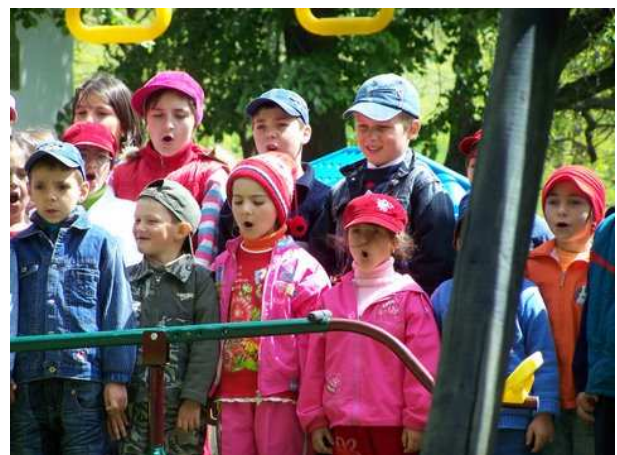
De bouwers worden toegezongen...