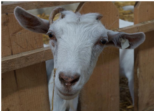
Een nieuwsgierige toeschouwer(st)er...

Voor ons was het een nieuwe ervaring om midden in zo'n bijzondere entourage bouwactiviteiten uit te voeren. De cliënten van de zorgboerderij, met ieder zijn/haar eigen geschiedenis, karakter en soms "gebruiksaanwijzing", droegen op eigen wijze hun steentje bij aan de totstandkoming van hun toekomstige werkomgeving. Uiteraard ging dit gepaard met veel handen- en voeten-taal. Dat geeft ons een goed gevoel, en vertrouwen dat we veel "eer van ons werk" krijgen wanneer de kaasmakerij daadwerkelijk in gebruik wordt genomen!