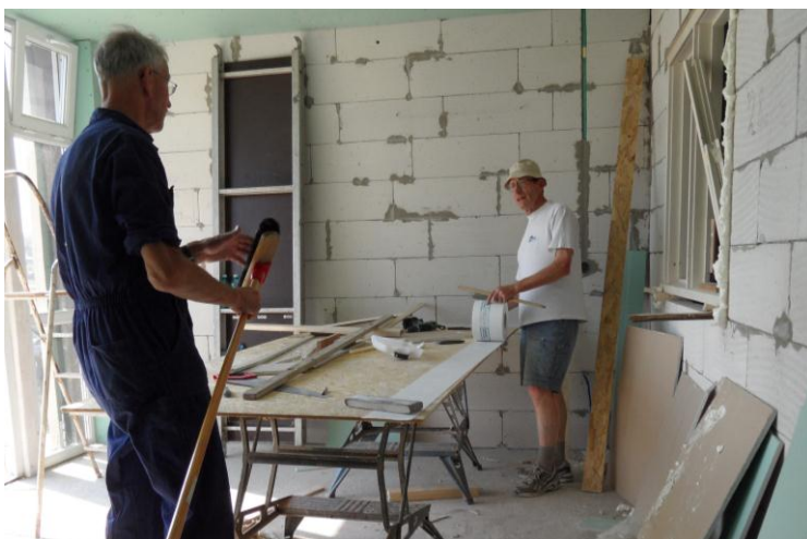
In de warmte, werken aan de wanden...

Ook een aantal jongeren (cliënten van de zorgboerderij) hielp enthousiast mee, en had verbazend weinig instructie nodig. Zo verliep het aanreiken van de vele wand- en vloertegels bijzonder effectief, en verlichtte het werk van de vakkundige zettters aanzienlijk!