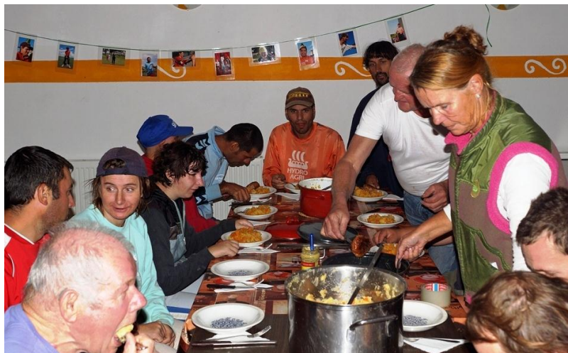
Afscheid met een hutspotmaaltijd...

Nog even wachten op het echte openingsfeest dus, maar wij namen afscheid van een tijdelijke werkomgeving die diepe indruk heeft gemaakt op onze mensen.