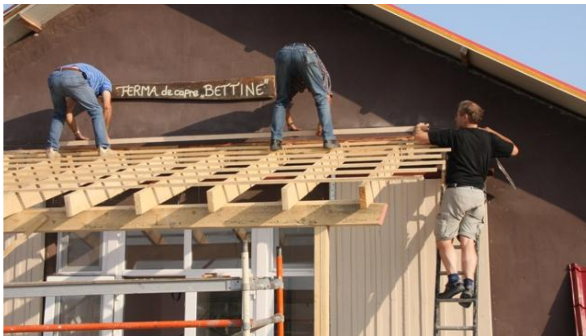
De luifelbouwers laten zich van hun beste kant zien...

Bij het plaatsen van het (spatwaterdichte) elektrisch schakelmateriaal bleek dat inbouw- en opbouw delen niet goed op elkaar pasten. Dit is door professioneel improviseren opgelost, maar dat moeten we bij een volgend project voorkomen door de verantwoordelijkheid voor de aanschaf bij één voorbereidingsteam te leggen.