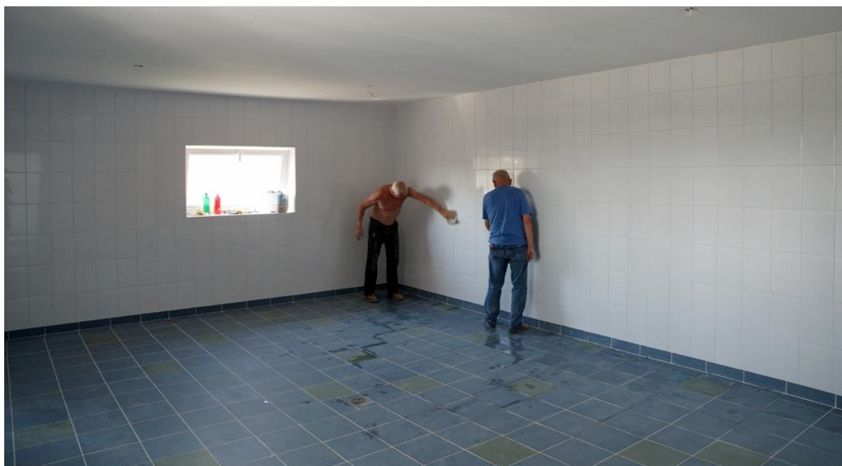
Heel veel tegelwerk...

Naast het aanleggen van de elektrische installatie en het bouwen van de luifel bij de hoofdingang, heeft de derde groep nog diverse puntjes op de i gezet, zoals het afhangen van de deuren en klein schilderwerk.