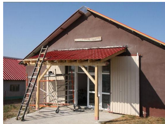
Het gebouw (bijna) gereed...