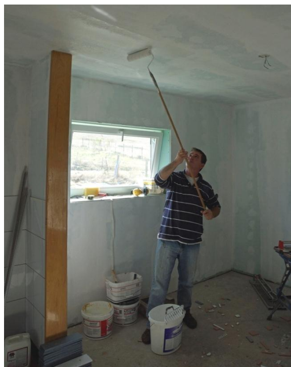
Afwerken van het plafond...

Het plaatsen van het centrale verwarmingssysteem is uitbesteed aan een lokale installateur, waarmee eventuele problemen met de goedkeuring door het gasbedrijf ook meteen voorkomen worden.