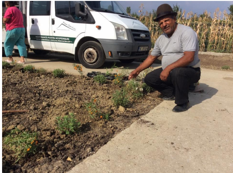
Inrichting van het buitenterrein door de gemeente Plopana...

Ook zette zij deelnemers aan een werkvoorzieningsprogramma in, onder andere voor graafwerk ten behoeve van de nutsvoorzieningen.