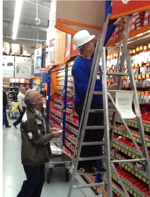
Aankoop van bouwmaterialen...

Het bescheiden positieve resultaat over 2017 wordt toegevoegd aan de bestaande reserves, en dient in dit geval als startkapitaal voor een, naar we hopen, volgend project.