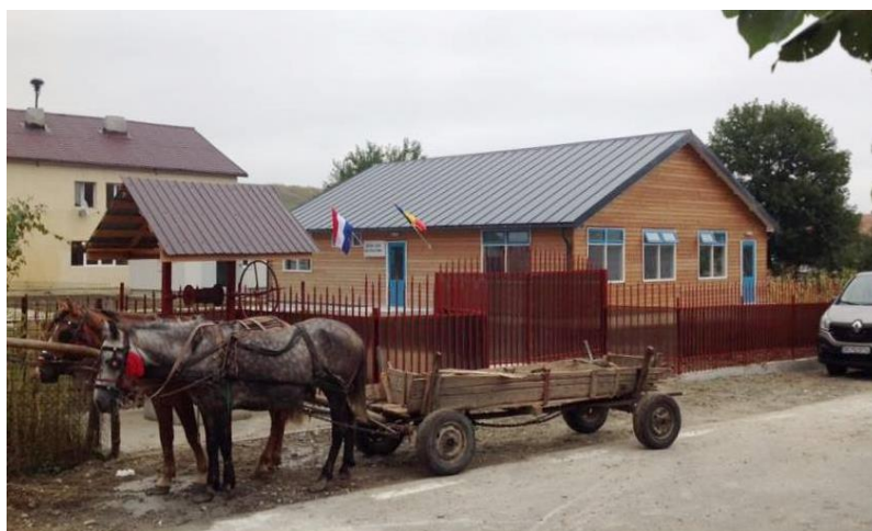
Het nieuwe gebouw in het Plopaanse straatbeeld...

Deze nieuwe faciliteit is gericht op zorg en activiteiten voor kinderen, en begeleiding van hun ouders of verzorgers bij de opvoeding.