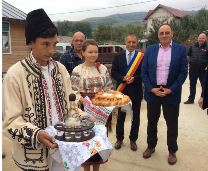
Lokale traditie tijdens de opening in Plopana...

De aanvragen voor een bijdrage uit (vermogens)fondsen aan het project Plopana zijn reeds in de voorgaande jaren ingediend en gehonoreerd. In 2017 is de verantwoording daarvan aan de betrokken organisaties gerapporteerd.